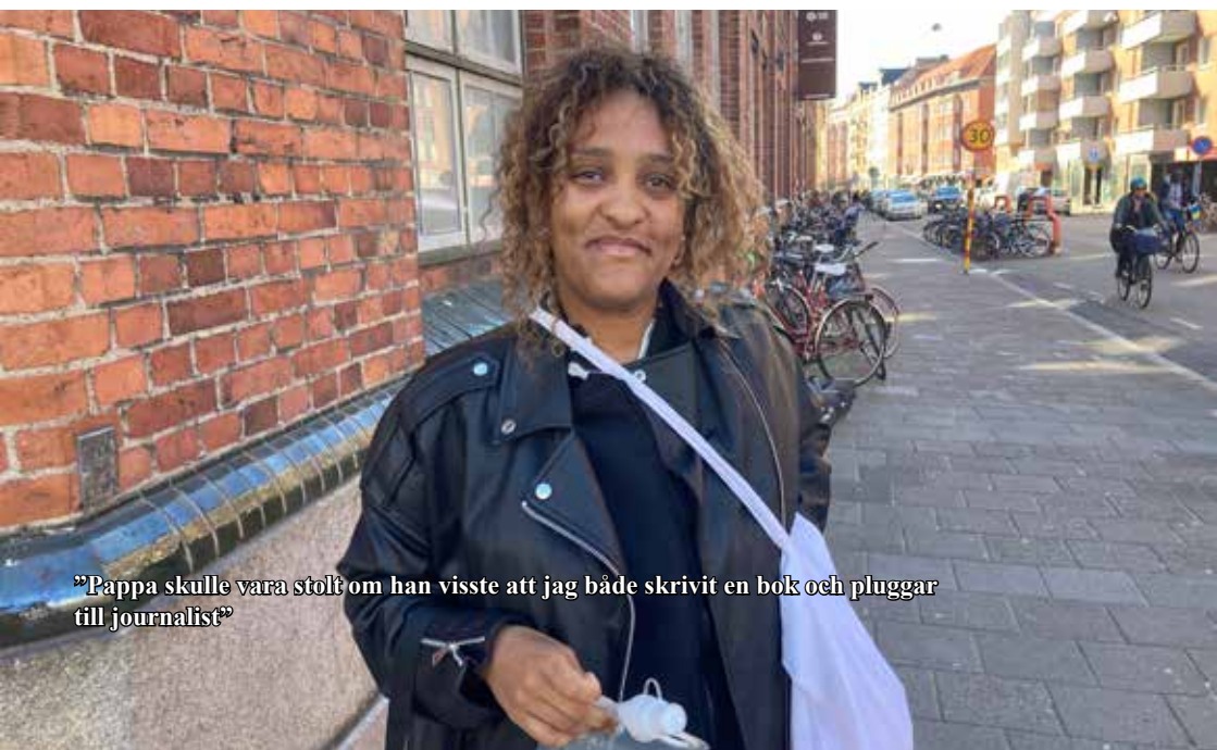
”Pappa skulle vara stolt om han visste att jag både skrivit en bok och pluggar till journalist”

– Det känns konstigt. Men samtidigt skönt att han inte har glömts bort. Men faktum kvarstår: Det finns bara förlorare i det här, säger Betlehem och försvinner i folkmyllret.