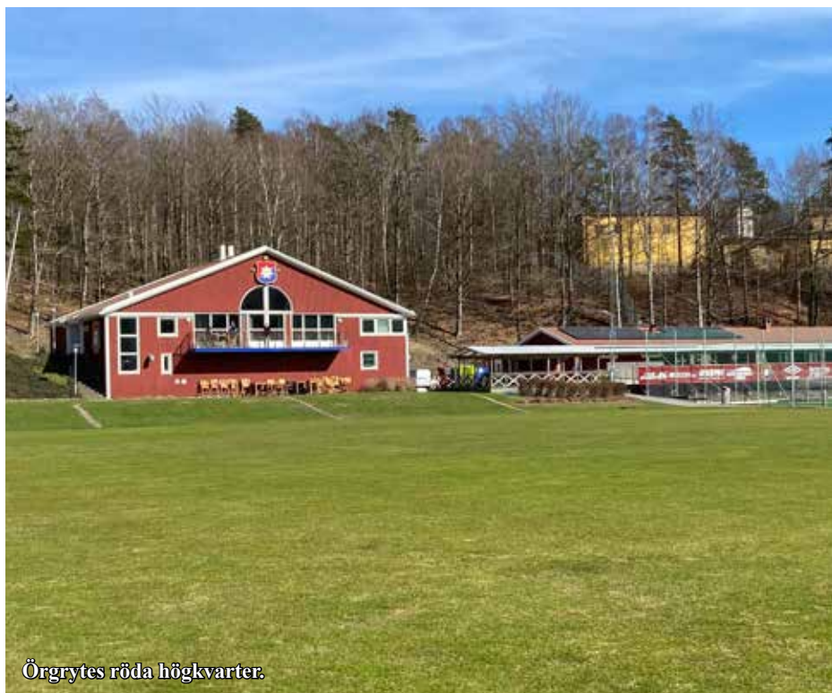
Örgrytes röda högkvarter.